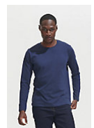
SOL'S Imperial LSL MEN 02074