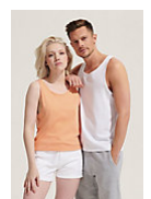
SOL'S CRUSADER TT 03980