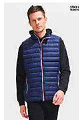
SOL'S VICTOIRE BW MEN 02916