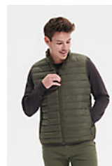
SOL'S STREAM BW MEN 04020